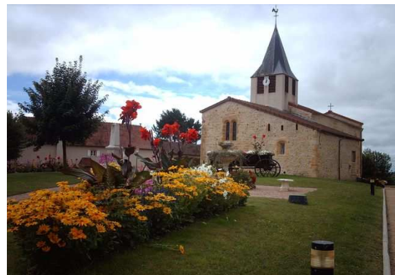
...Et en 2011

(* ) La confirmation est le sacrement consistant à oindre d'huile sainte une personne baptisée afin qu'elle reçoive le don du Saint Esprit. Alors que, par le baptême, le baptisé meurt et ressuscite avec le Christ, le confirmé est empli de l'Esprit Saint comme l'ont été les Apôtres le jour de la Pentecôte. En tant que tel, la confirmation confirme l'appartenance du baptisé à l'Église comme communion dans le même Saint Esprit. Baptême et Confirmation sont donc très intimement liés : la confirmation est en quelque sorte l'achèvement du Baptême.