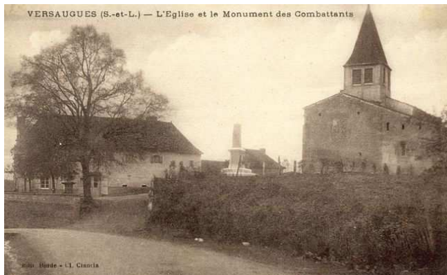
L'église et le monument aux morts en 1922...