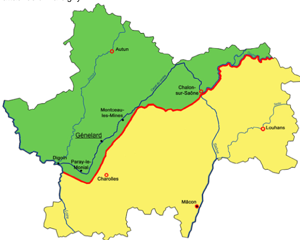
La ligne de démarcation en Saône-et-Loire, tracé de décembre 1941

L'armée allemande occupe la partie nord et nord-ouest du département de Saône et Loire et une ligne de démarcation est mise en place. Les limites séparatives des deux zones sont installées au-delà de Saint Yan. Située en zone libre, Versaugues est isolée de Paray Le Monial et de Digoin et se trouve rattachée à Marcigny.